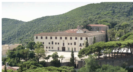
Casa de Colònies La Conreria

A la Casa de Colònies "La Conreria". Situada a només 10 Km de Mollet, al Parc natural de la Serra de Marina. La casa disposa de múltiples espais i serveis pensats per activitats esportives i estades de pretemporada.